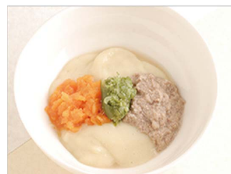
舌でつぶせる硬さ