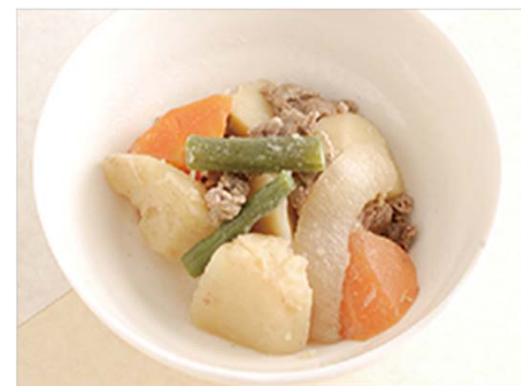
簡単にかめる硬さ

症状に合わせて、簡単にかめる硬さ、歯ぐきでつぶせる硬さ、舌でつぶせる硬さ、かまなくても良い状態等さまざまな段階がある。