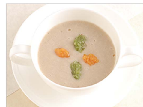
かまなくてもよい状態

そのような方々に、健康な方と同じ食事でも、症状にあった形態のものを用意し、自分の力で味わうための食事が介護食です。激を与え、食べる喜びを持ってもらうための食事が介護食です。