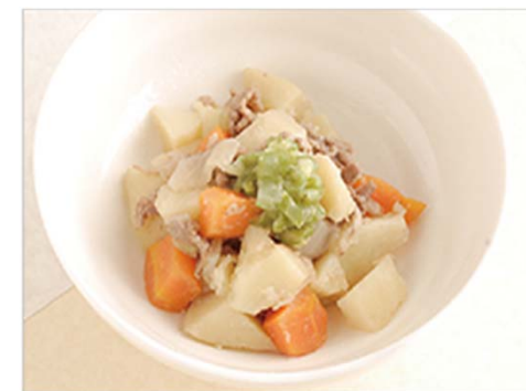
歯ぐきでつぶせる硬さ